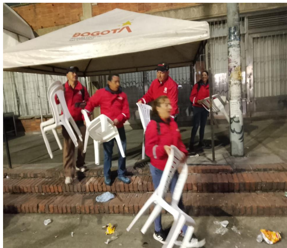
Foto 6. Se realiza apoyo logístico con el cargue de las sillas.