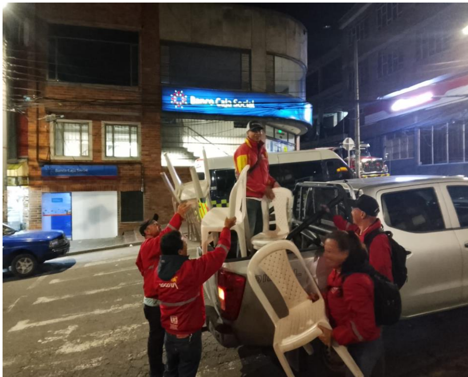
Foto 7. Cargue la las sillas en la camioneta de la alcaldía.