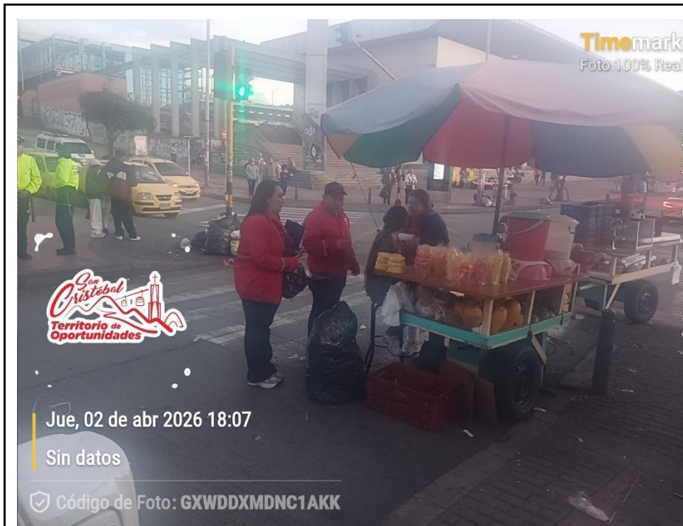
Foto 3. Sensibilización a los vendedores informales sobre el buen uso del espacio público y se les hace un llamado para que no dejen basuras en el puesto de trabajo.