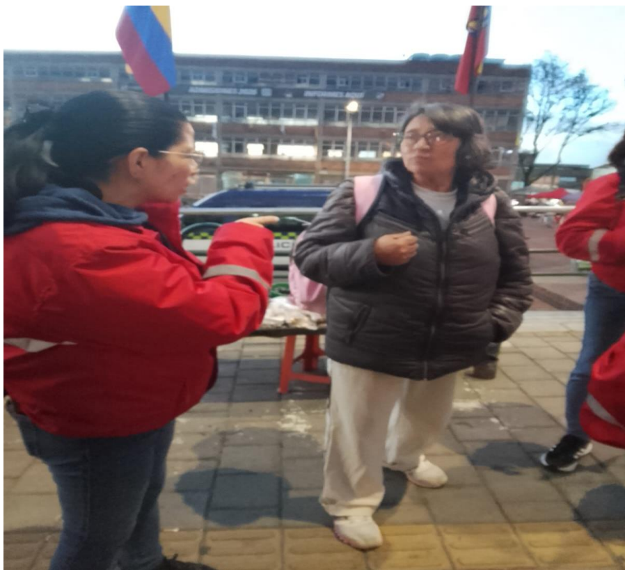
Foto 5. Se les brinda información a los visitantes del sector sobre la programación de la semana santa.