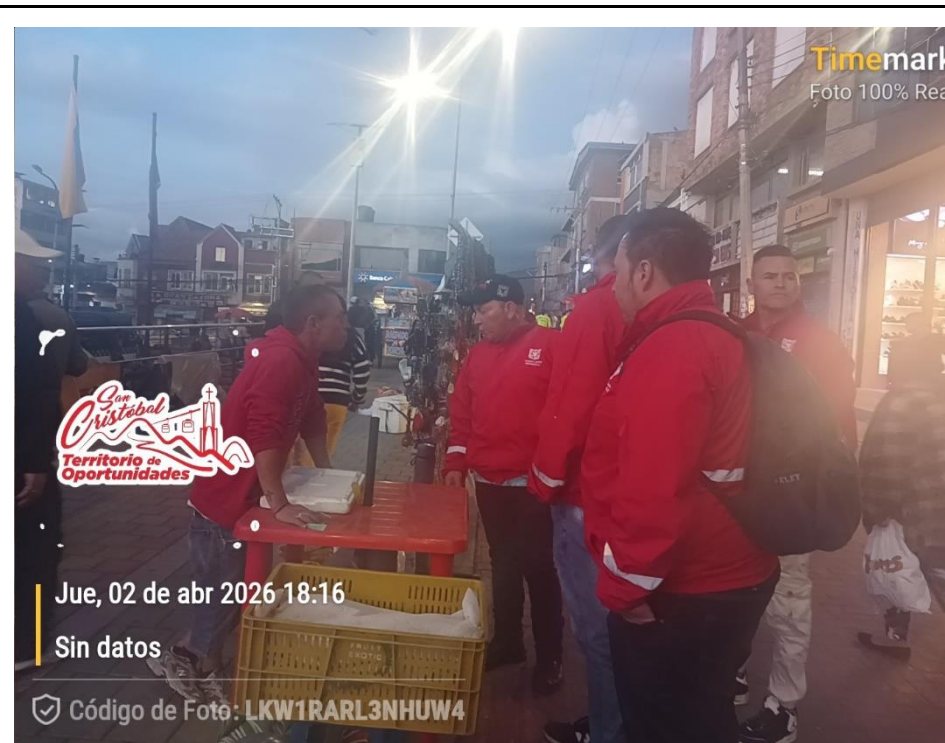
Foto 4. Sensibilización a los vendedores informales sobre el buen uso del espacio público según la ley 1801 de 2016 (código de policía) y el decreto 315 del 2024 en Bogotá.