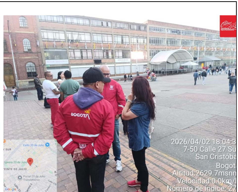
Foto 2. Se sensibiliza a la comunidad para que tenga cuidado con sus pertenencias.